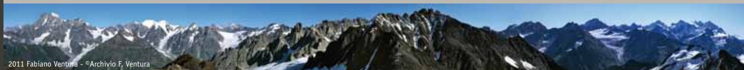
2011 Fabiano Ventura - ©Archivio F. Ventura